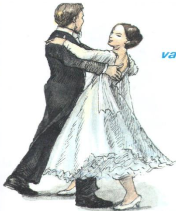
valčík – tanec v \frac{3}{4} takte