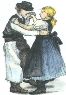
polka – tanec v \frac{2}{4} takte

Valčík i polku si vypočujte a zatancujte.