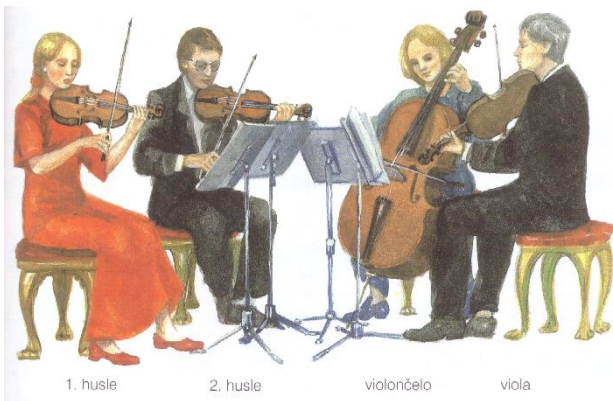
1. husle 2. husle violončelo viola

Sláčikové kvarteto je zoskupenie 4 nástrojov: prvé husle, druhé husle, viola, violončelo. Ktorý sláčikový nástroj tu chýba? ..... Veľa sláčikových kvartet písal hudobný skladateľ Jozef Haydn .