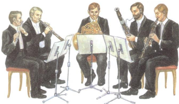
flauta hoboj lesný roh fagot klarinet

Ukážka: Haydn: Sláčikové kvarteto „Škovránok“ https://www.youtube.com/watch?v=4uYxn1M_O-4